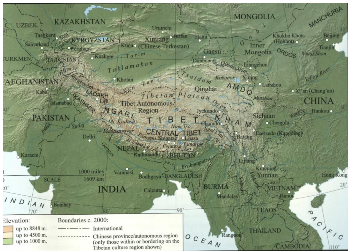
Ryavec 2015. Map 1.